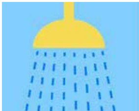
Prendre sa douche