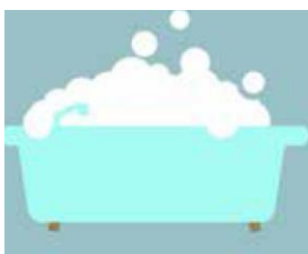
Prendre un bain