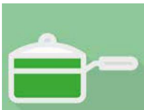
Manger et boire