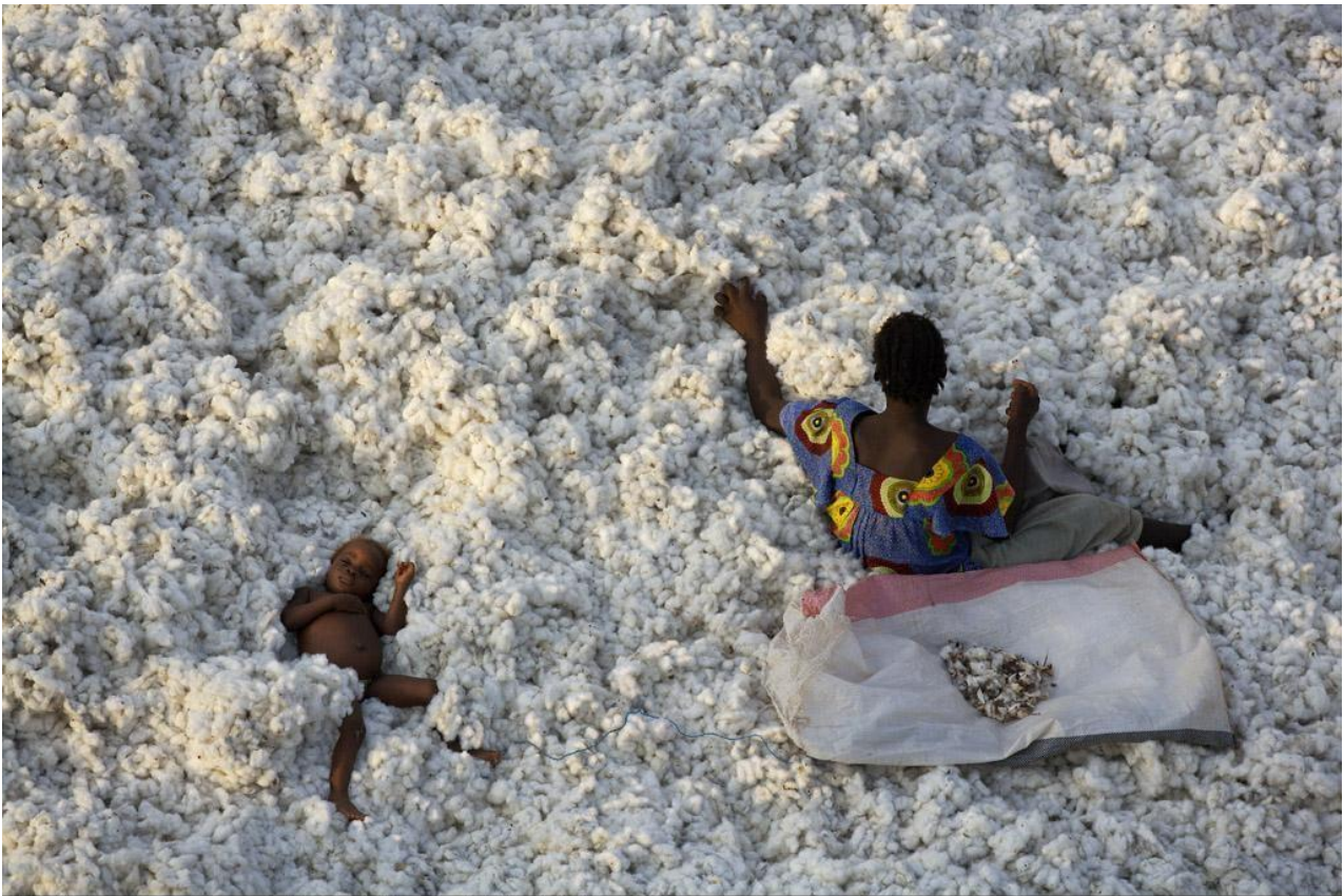
R?colte du coton aux environs de Banfora, Burkina Faso (10°48' N - 3°56' O).