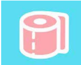
Tirer la chasse

Relie chaque image avec le bon nombre de litre d'eau qu'elle consomme.